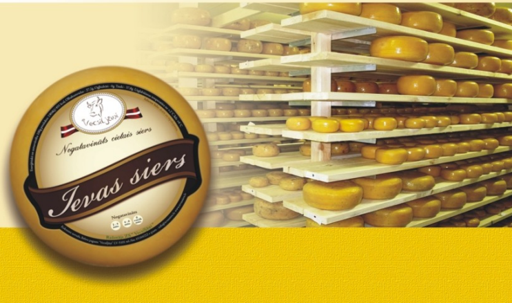
Mūsu "Muižas siers ar ķīmenēm" 2010. gadā apbalvots ar Siera karaļa kroni.